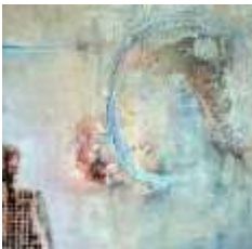
26 Der Beobachter | 2016 CollagenMalerei | 40x40cm