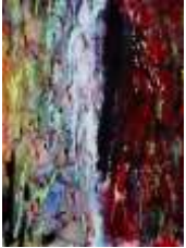
9 Die andere Hälfte | 2010