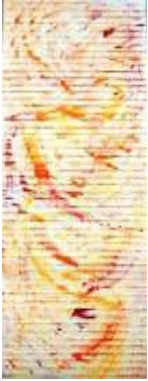
25 Morgenstimmung | 2010 Gouache auf Reispapier | 200x60cm