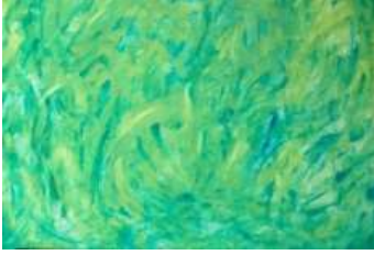
Das Geheimnis | 2011