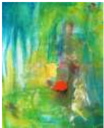
22 Mittendrin die Schweiz | 2011

Mischtechnik auf Pappe, Resonance Gold | 50x40cm