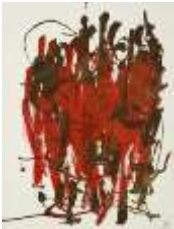
10 Bürger v. Calais | 2010