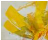
21 Inner colour of the day | 2016