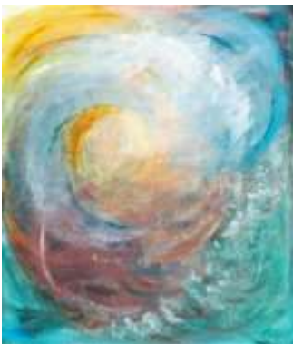
27 Meditation | 2003 Gouache auf saugender Pappe | 100x90cm