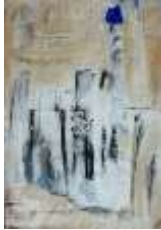
20 New town in desert | 2015