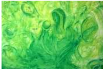
11 Die Frage | 2011 | Gouache und Farbstifte auf Leinwand | 50x70cm