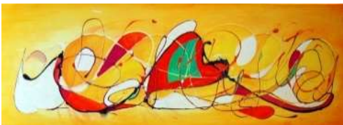
13 Farbe im Herz | 2011