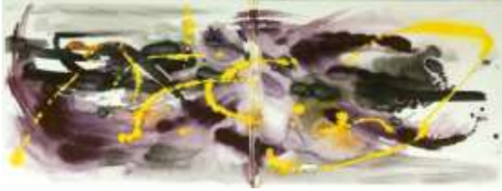
24 Vulcano in luce del giorno | 2010 Tinte auf Aquarellpapier | 40x110cm