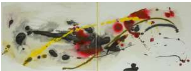
23 Vulcano di notte | 2010

Mischtechnik auf Pappe, Resonance Gold | 50x40cm