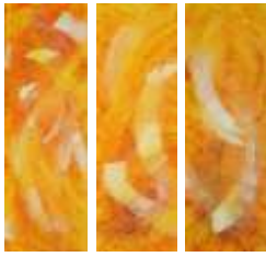
19 Zentrum | 2008 Triptychon